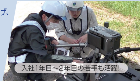
入社1年目~2年目の若手も活躍!

地元で50年余の間 集積した経験・知識 、そして 技術者層の厚み をコア・コンピタンスとして掲げ、県内在住の地質・土質解析技術者20名+後方支援スタッフ13名(令和5年12月現在)。プロジェクトごとに専門技術者と後方支援スタッフでチームを組み、各自の経験・知識を活かした 迅速な対応 と 技術力向上・技術継承 に注力する体制を構築しています。