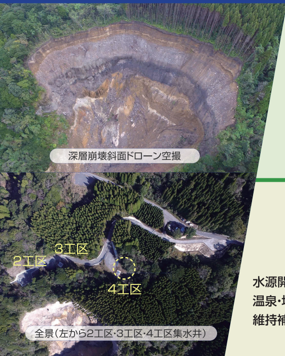
深層崩壊斜面ドローン空撮

地盤に関わる多分野に対応可能です。 フットワークを生かし、鹿児島県を中心に、南九州での調査・施工でお役に立った実績があります。