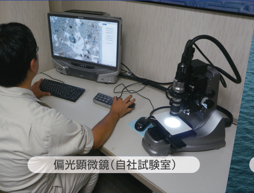
偏光顕微鏡(自社試験室)